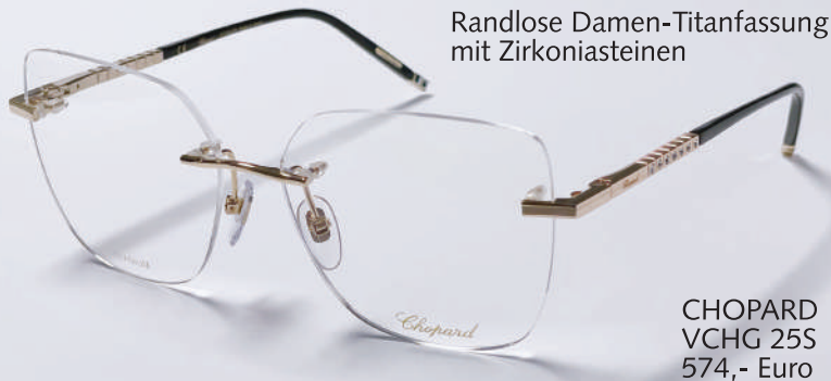
Randlose Damen-Titanfassung mit Zirkoniasteinen