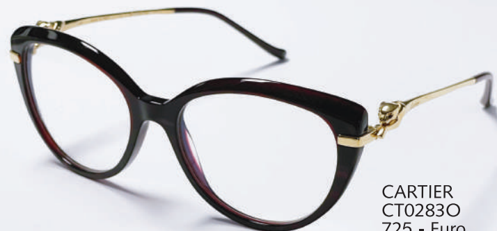
CARTIER CT02830 725,- Euro

Die abgebildeten Brillen sind Modellbeispiele aus unserem umfassenden Sortiment. Vorlage und individuelle Beratung nach vorheriger Terminvereinbarung.