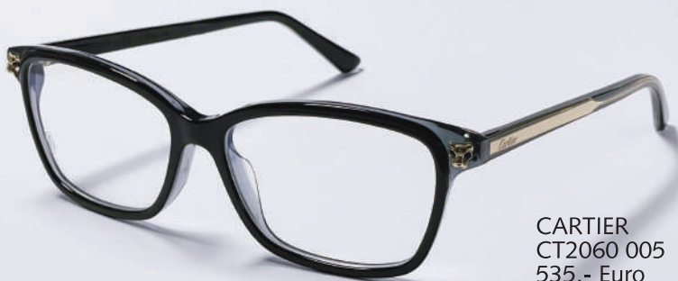
CARTIER CT2060 005 535,- Euro