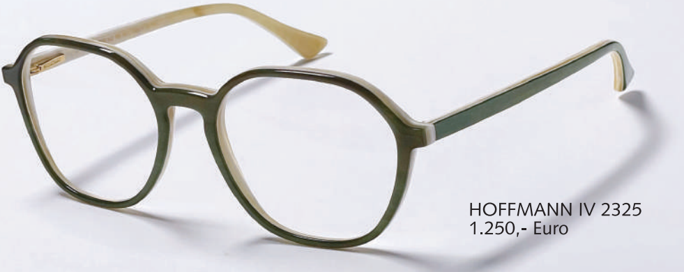
HOFFMANN IV 2325 1.250,- Euro