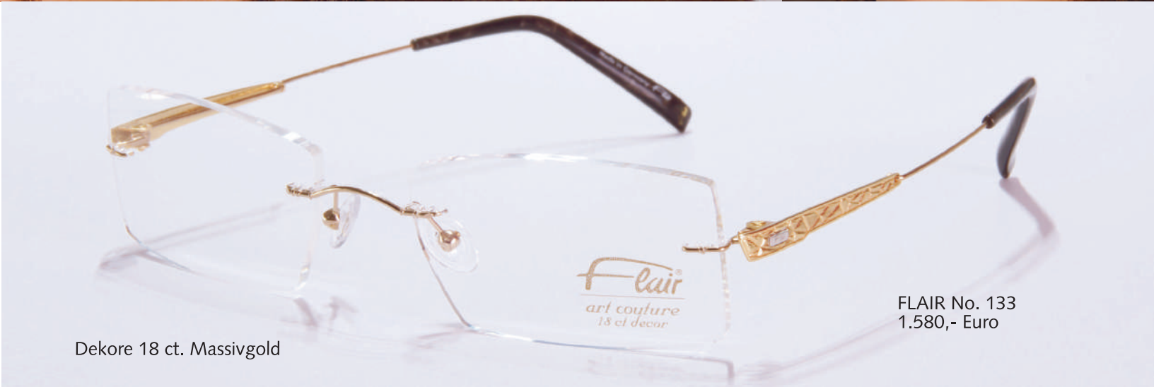
Dekore 18 ct. Massivgold