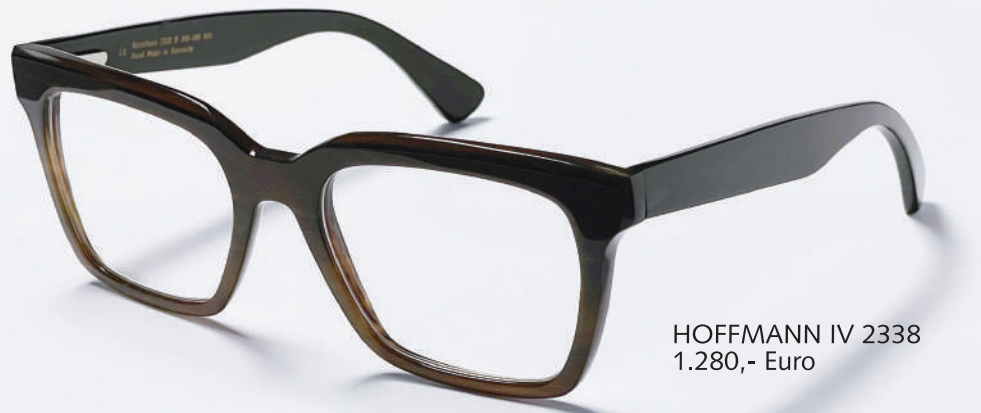
HOFFMANN IV 2338 1.280,- Euro