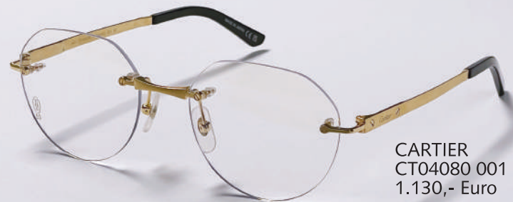
CARTIER CT04080 001 1.130,- Euro