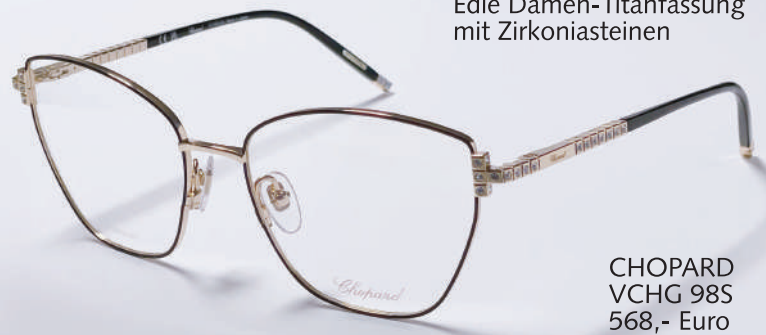
Edle Damen-Titanfassung mit Zirkoniasteinen