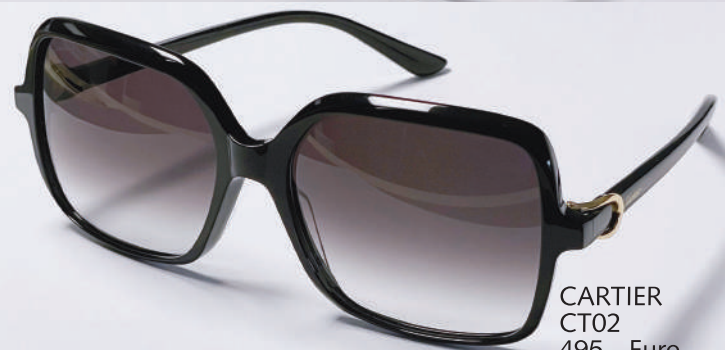
CARTIER CT02 495,- Euro