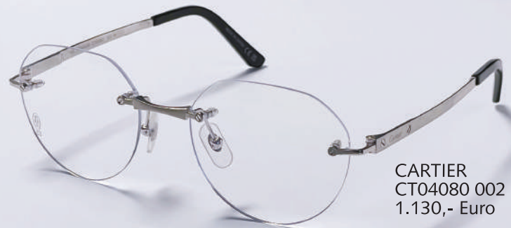
CARTIER CT04080 002 1.130,- Euro