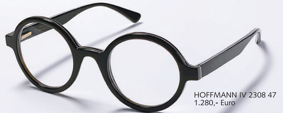
HOFFMANN IV 2308 47 1.280,- Euro