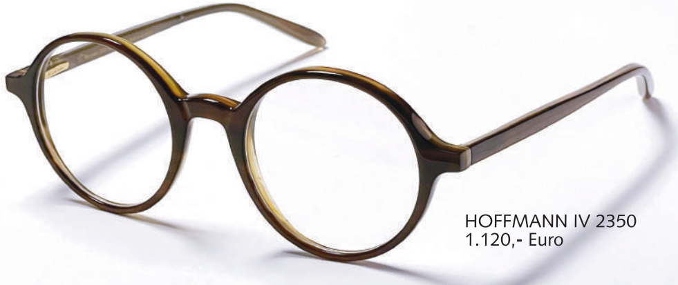
HOFFMANN IV 2350 1.120,- Euro