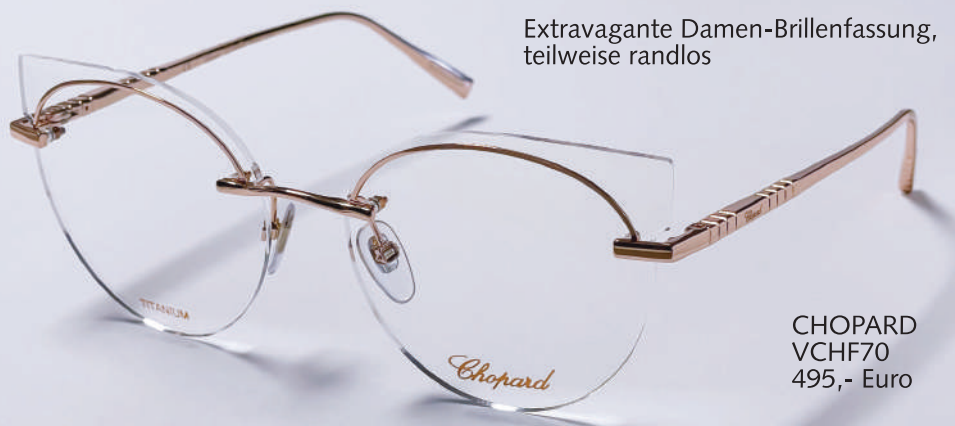
Extravagante Damen-Brillenfassung, teilweise randlos