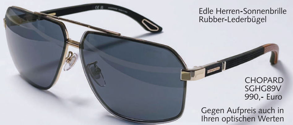
Edle Herren-Sonnenbrille Rubber-Lederbügel