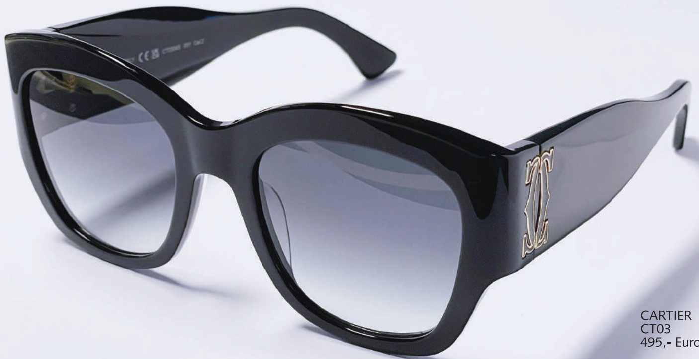
CARTIER CT03 495,- Euro