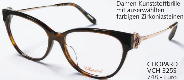
Damen Kunststoffbrille mit auserwählten farbigen Zirkoniasteinen